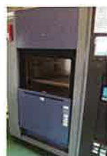
-10°C ~ 100°C ヒートサイクル試験