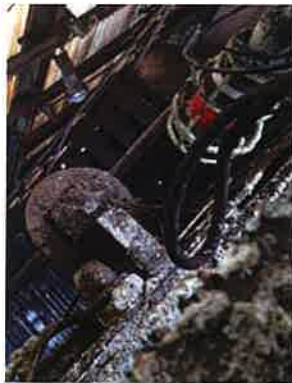
酸洗処理工場 (硫酸・硝酸・フッ酸環境)