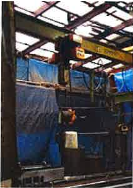
めっき処理工場 (酸・アルカリ浴槽)

レンズ部やケーブル類は耐薬品性素材の特殊グレードを使用しております。アルミ素材部は、フッ素コーティング処理を施しており、腐食を防ぐことができます。